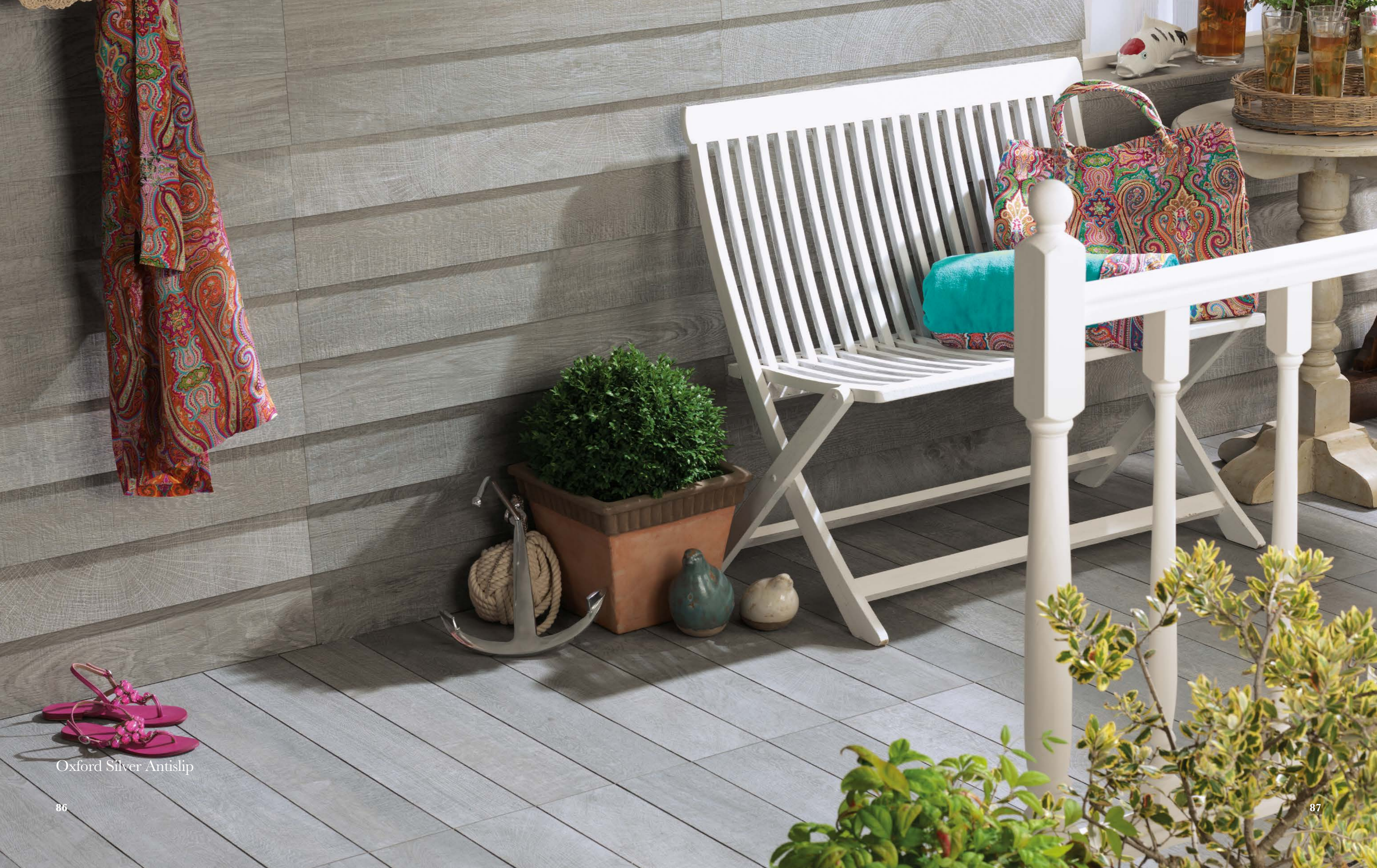
Oxford Silver Antislip