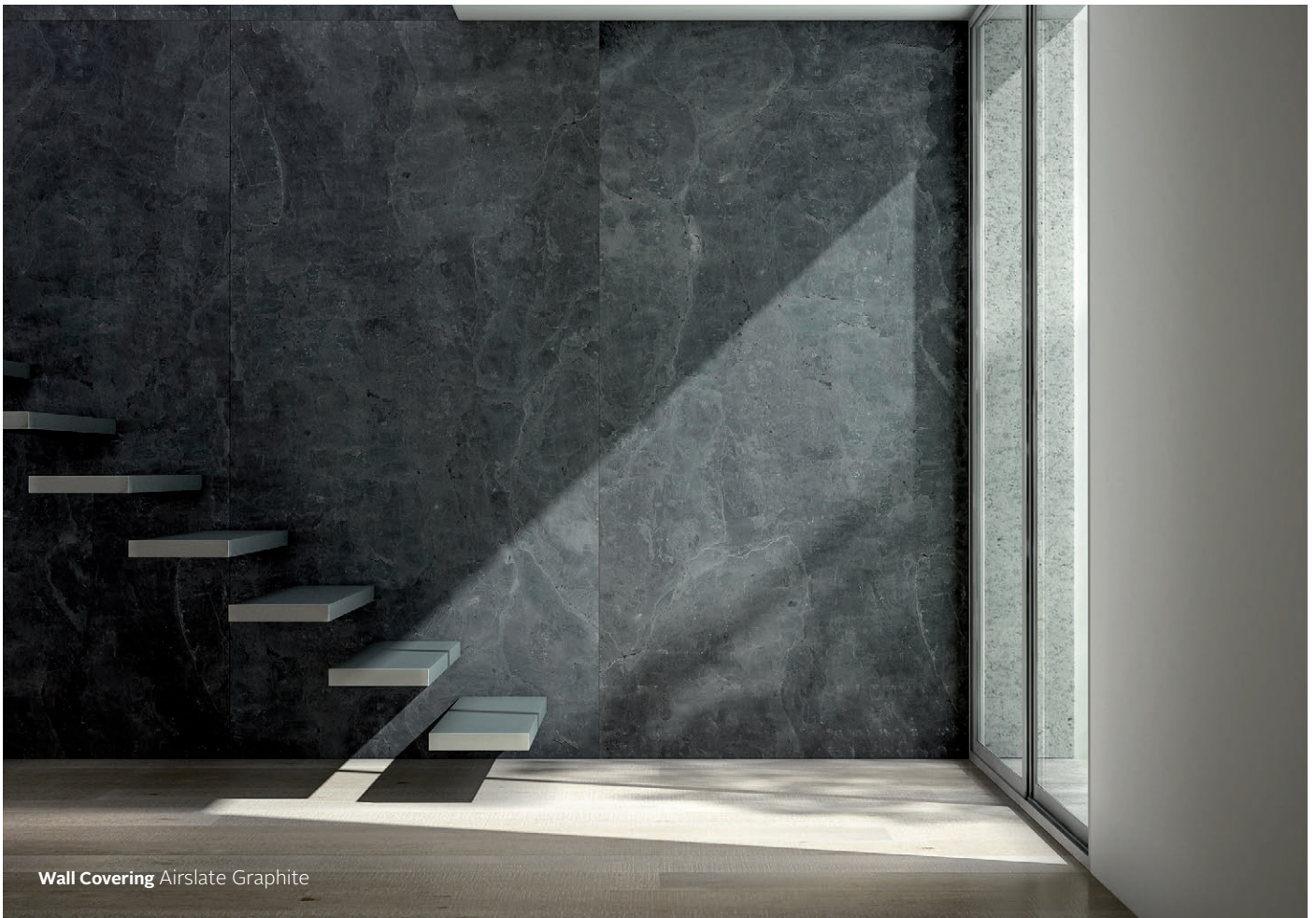
Wall Covering Airslate Graphite