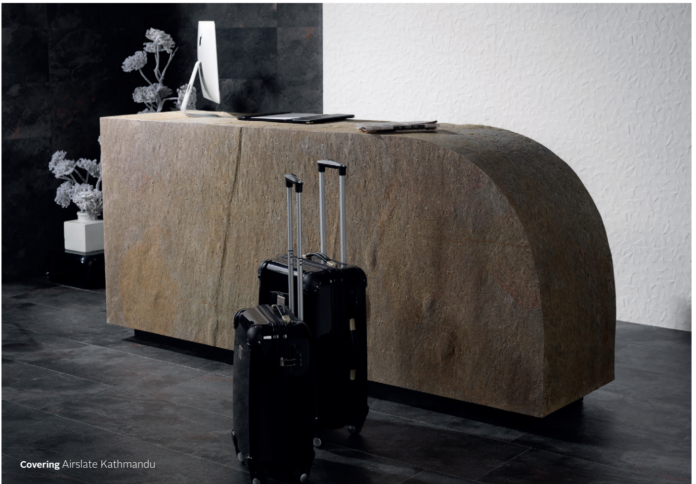
Covering Airslate Kathmandu