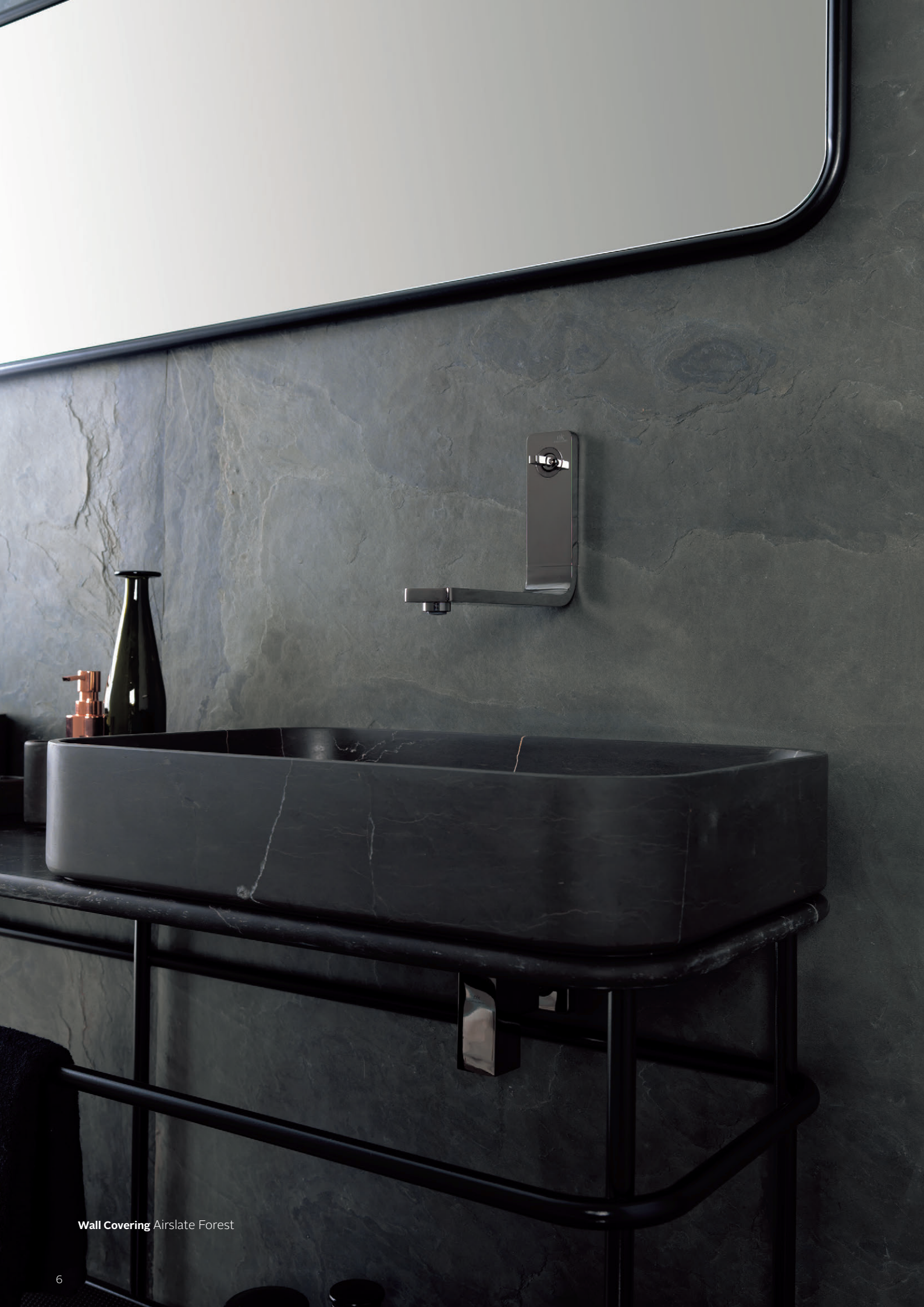
Wall Covering Airslate Forest