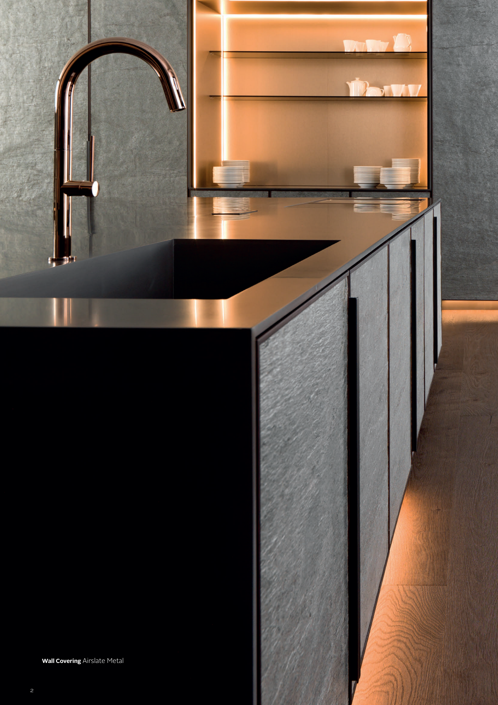
Wall Covering Airslate Metal