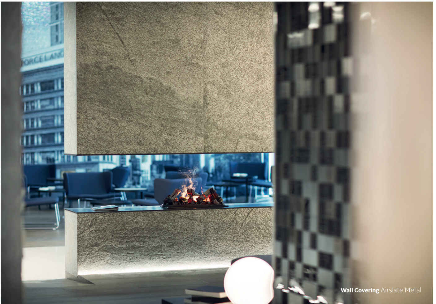
Wall Covering Airslate Metal