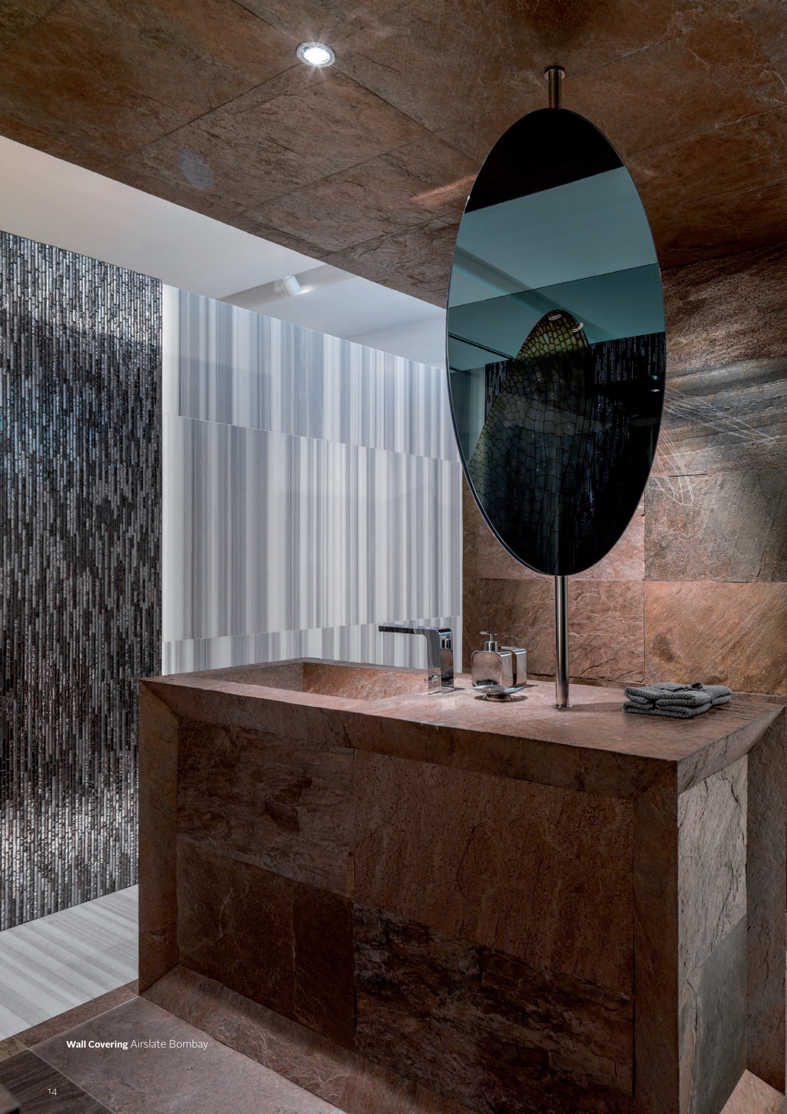
Wall Covering Airslate Bombay