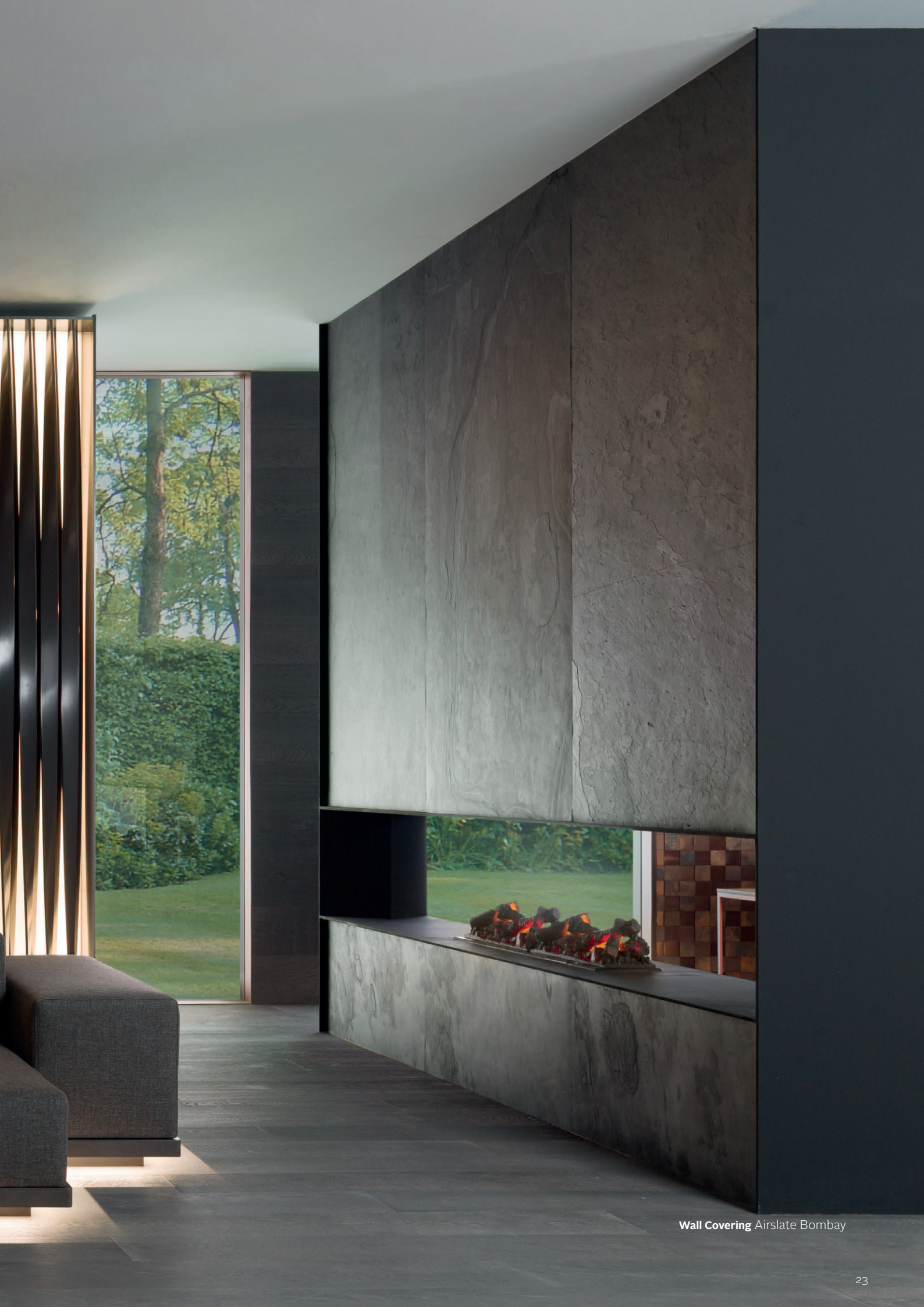
Wall Covering Airslate Bombay