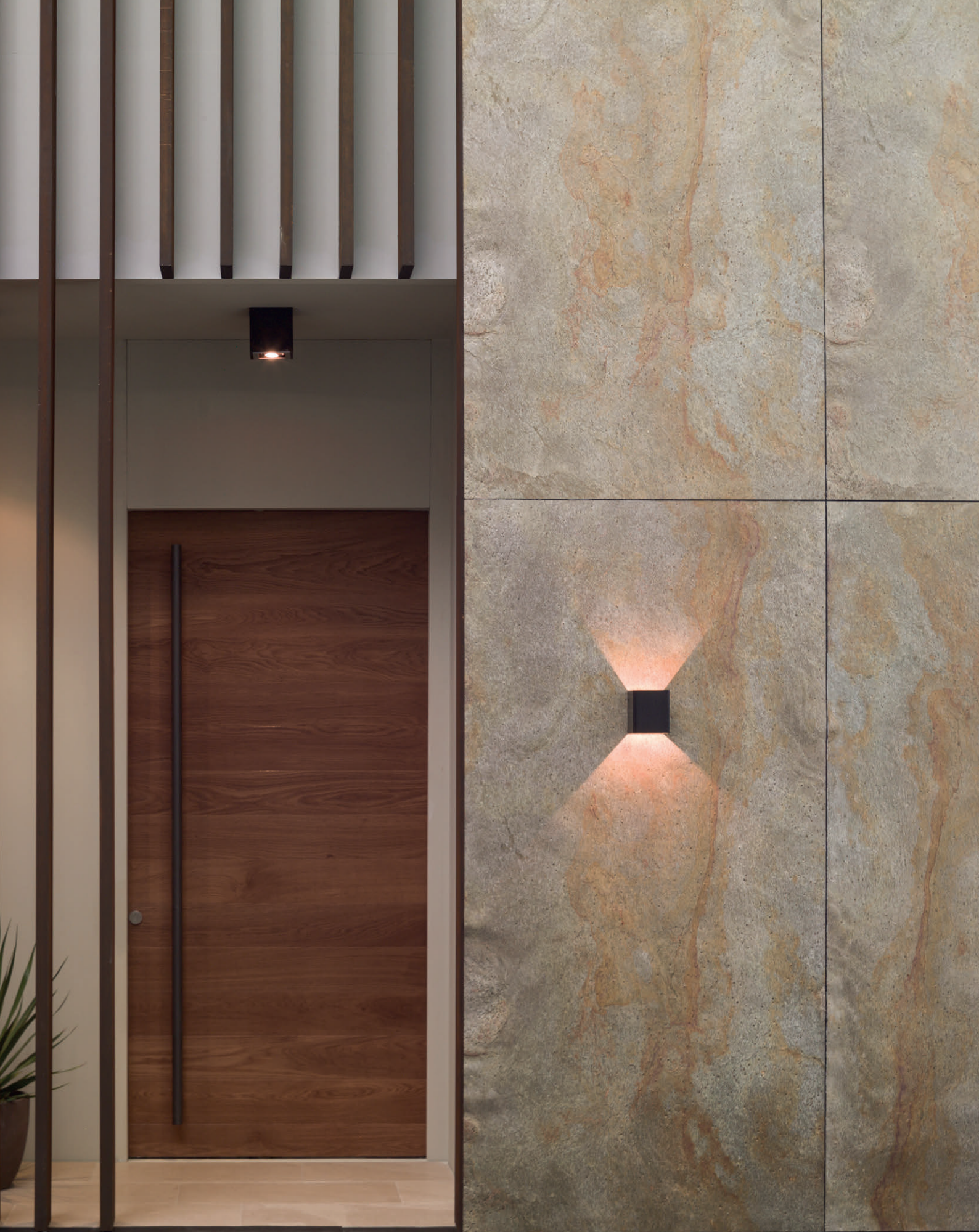
Wall Covering Airslate Kathmandu