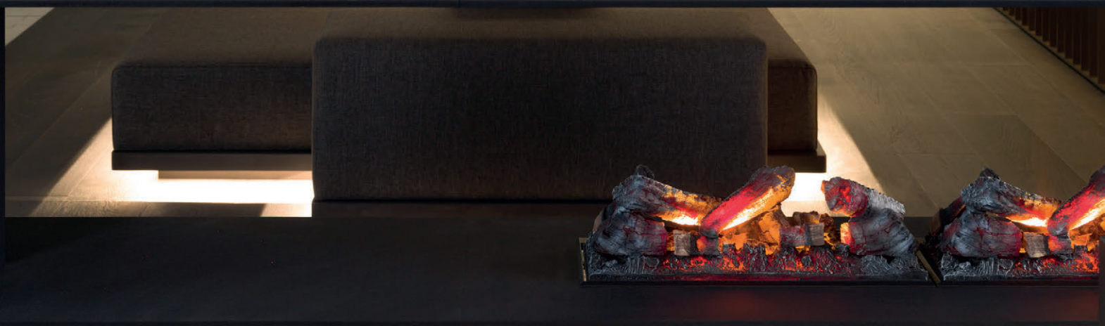
Wall Covering Airslate Bombay