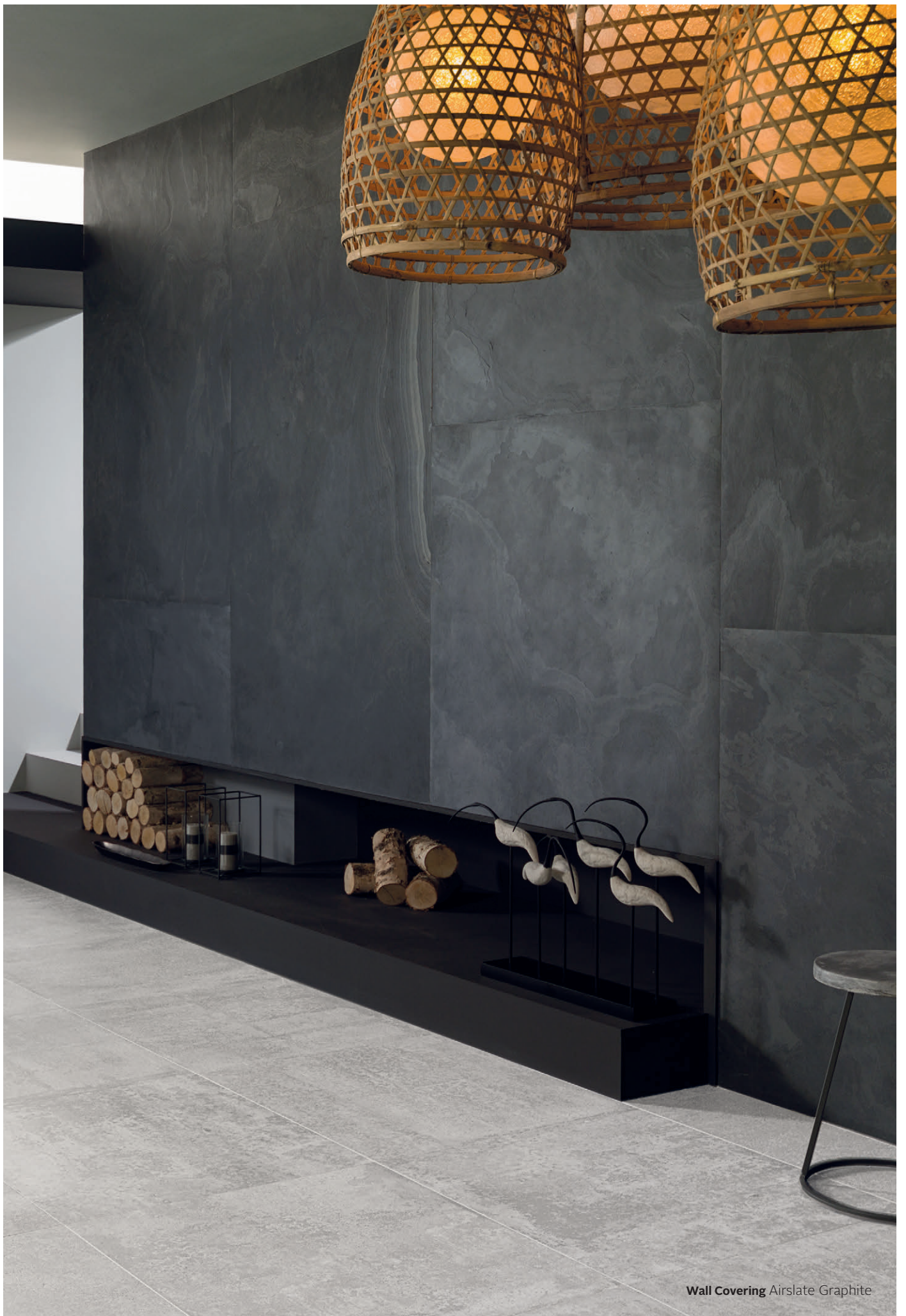
Wall Covering Airslate Graphite