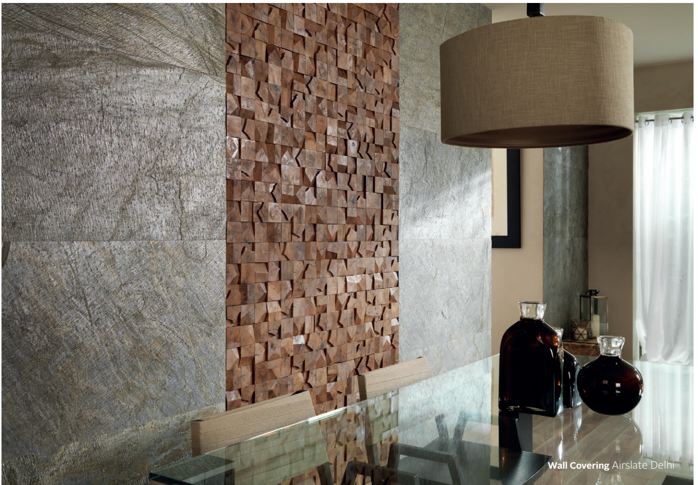
Wall Covering Airslate Delhi