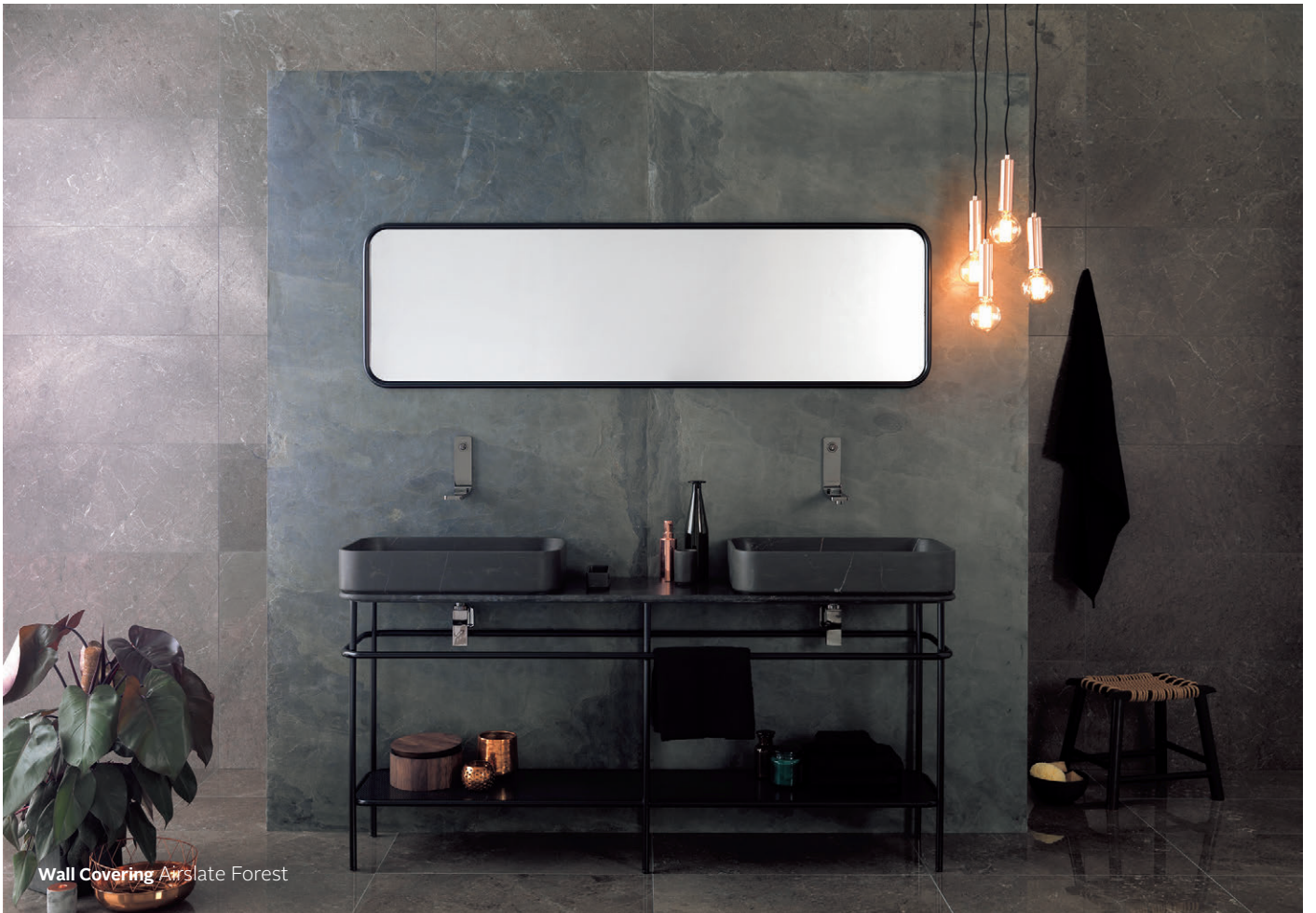
Wall Covering Airslate Forest