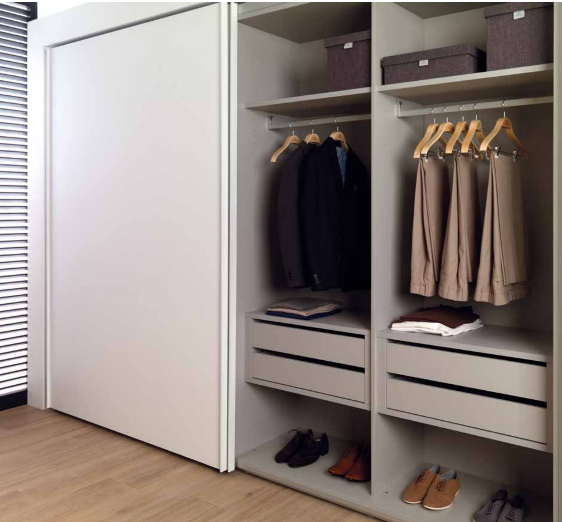
F2.80 Blanco Leather / Zinc Leather